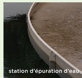
station d'épuration d'eau